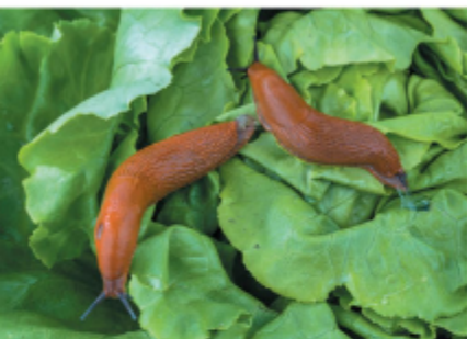
Când este vreme ploioasă, melcii ies din ascunzătoare.

ANIMALELE SE SIMT FOARTE BINE ÎN MULTE GRĂDINI, MAI ALES ÎN CELE SĂLBATICE. AICI AU SUFICIENTĂ MÂNCARE ȘI TRĂIESC BINE.