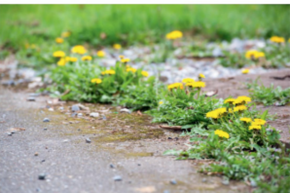
Poți găsi natură chiar și pe trotuar. Păpădiile cresc în orice crăpătură.

MULȚI ORĂȘENI CRED CĂ NU POT OBSERVA ANIMALE PENTRU CĂ NU TRĂIESC ÎN NATURĂ. NU ESTE ADEVĂRAT.