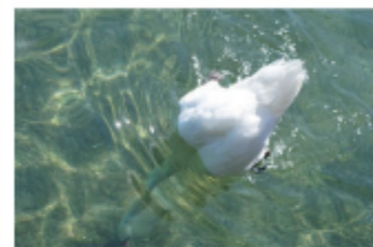
Cu gâtul și gâtul său lung, o lebădă poate urmări larve de peșci și insecte care se ascund în apă.