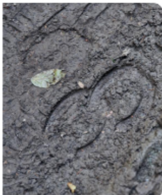
Știi de la ce animal provine urma asta?

Să știi că poți chiar să leel urmele de animale cu tine acasă. Pentru asta ai nevoie de o pungă de Ipsos (unul de calitate, care se întărește repede), de o cutie goală de lăur și de puțină apă. Pune pudra de Ipsos și apa în cutie și amestecă până nu mai sunt cocoloașe. După aceea varsă pasta în urma lăsată de animal și așteaptă până când se întărește. Se specifică pe ambalaj cât timp înseamnă asta. La final, ridică ușor placa de Ipsos – ar trebui să fie gata. Ai grijă, pentru că se poate crăpa. Acasă poți să îndepărtezi praful cu o perluță de dinți și să cauți pe Internet ca să afli de la ce animal este urma.